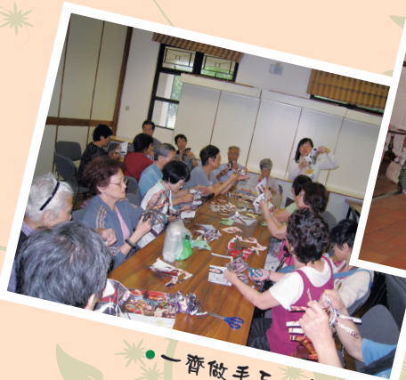
● 一齊做手工，多高興。

毅希會一行近80人，於2010年6月26至27日在樟木頭度假中心，度過了一個愉快的夏日週末宿營。中心臨近海邊，景色怡人，置身其中，使人暫時忘記市區的煩囂，盡享大自然的優美、同時可以與會友們齊齊耍樂，享用中心完備的設施，真的不亦樂乎！