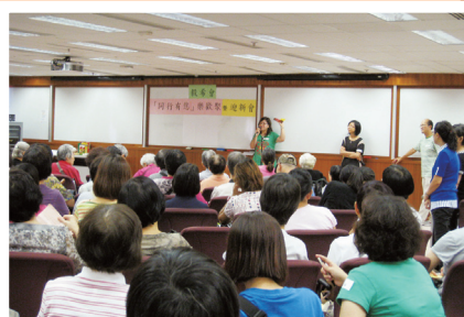
● 當天有「估價錢遊戲」，正是女士們領風騷之時。

黃醫生為我們頒獎給二十位被提名的照顧者一份心意禮物（筷子一雙）；及送出小禮物給十六位新會員。會友們見到黃醫生的前來，都十分欣喜雀躍。聚會中大家一齊玩遊戲、進食茶點。之後，有數位會友出來跟我們分享經歷及表揚身邊的家人，多年來怎樣對自己不離不棄、如何的細心的照料，並表達內心對家人的謝意。聽者均為之動容，深感人間有情、亦同時感受到他們心中的滿足和喜悅，世上最有力的支持，相信是發自最親近的親人。