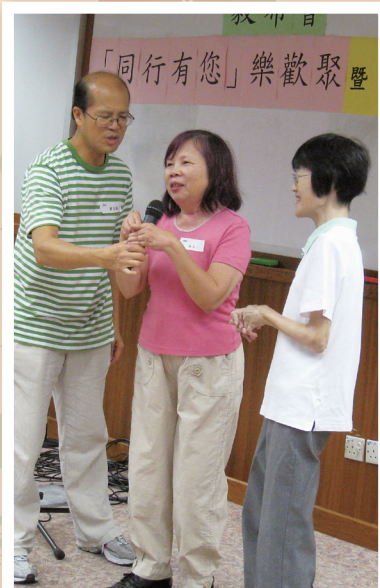
● 會員分享之時，情感細膩、內容溫情，令與會者動容。