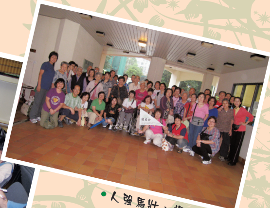
● 人強馬壯、場面熱鬧。