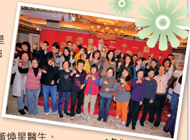
● 眾嘉賓與新舊會員向大家祝酒